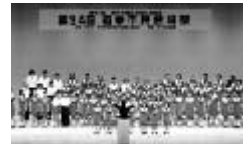
府中青少年少女合唱団

NHKコンクール予選金賞そして東京都本選銅賞を受賞した「都立府中西高等学校合唱団」と府中市内を中心に活動をしている「府中青少年少女合唱団」が歌のプレゼントをします。みんなで大きな声で合唱して会場全体を盛り上げましょう!