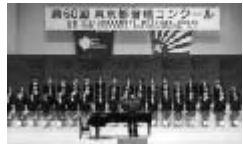
都立府中西高等学校合唱団